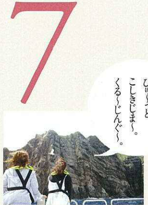
高速船でびゅっ、こしゅっ、くるしゅっ。